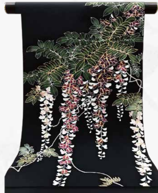
江戸友禅 手描 しおせ名古屋帯