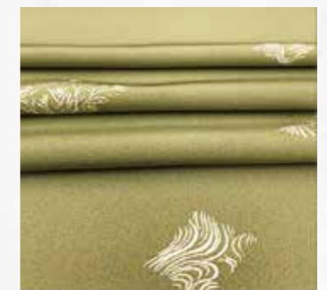
江戸友禅 手描 小紋